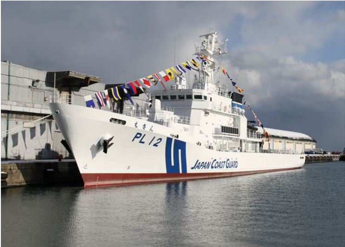
巡視船えさん就役式 28年11月25日 撮影) 【掲載内容】

年頭のごあいさつ 巡視船えさん就役式 巡視船ほるべつ年頭潜水訓練 国際スポーツ雪かき選手権 巡視船そうや海水観測 おたよりコーナー