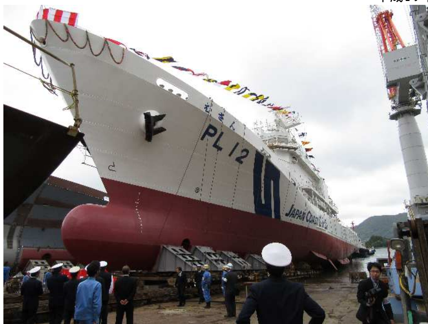
平成28年5月 進水式 三菱造船下関工場