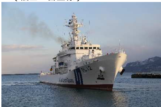
巡視船えさん小樽発入港